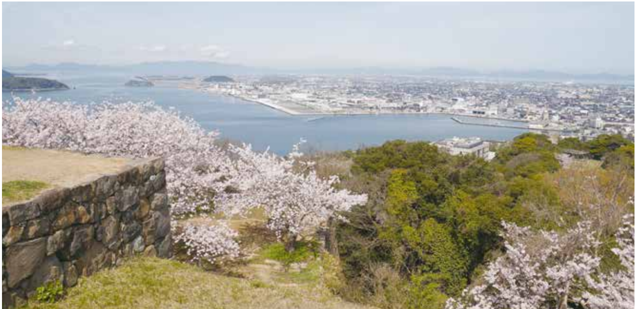
米子城跡頂上から、遠見郭、内膳丸方面の眺め