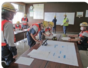
地震津波訓練の様子

「人命の保護を最優先に自然災害への備えを万全にする」を2022年基本方針として掲げ、年間防災計画を立案し毎月の活動を行っています。