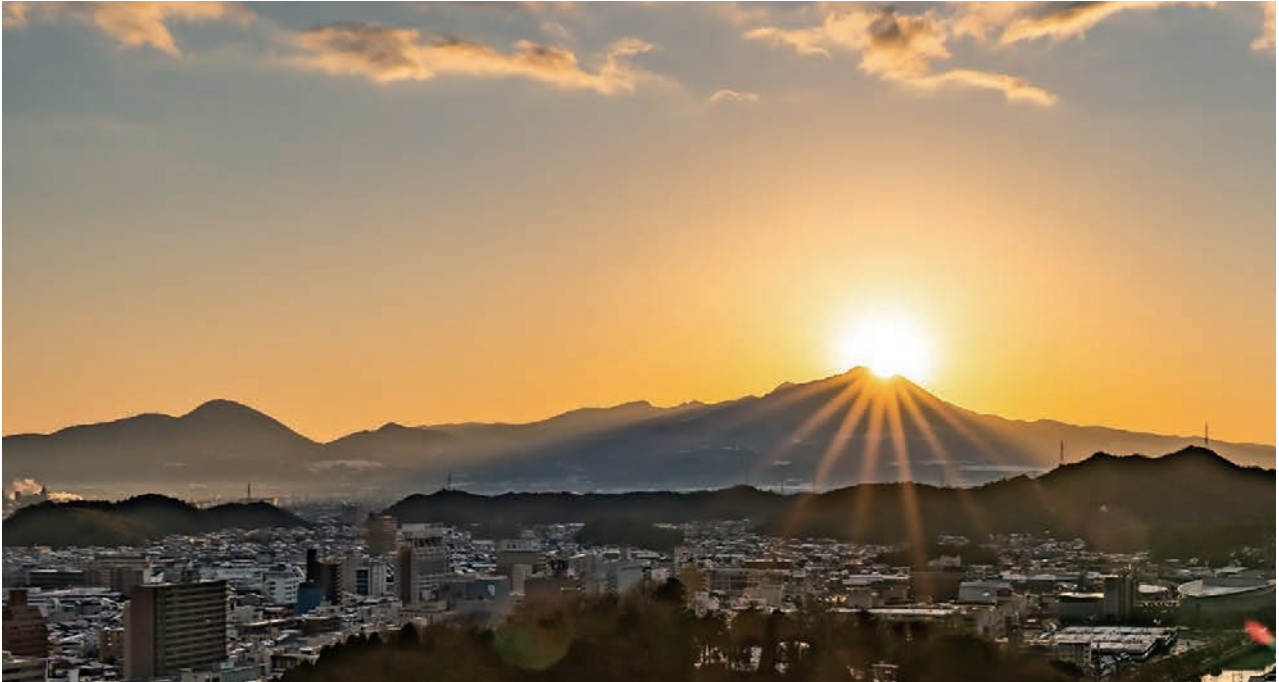
米子城から臨むダイヤモンド大山