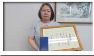
日ノ丸産業株式会社 米子支店 様