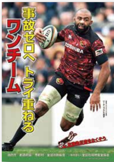
令和3年度 危険物安全週間推進標語