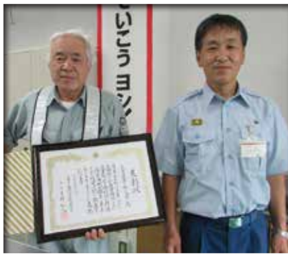
【危険物優良事業所表彰】 丸彦産業株式会社 様