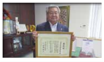
山陰信販株式会社 様