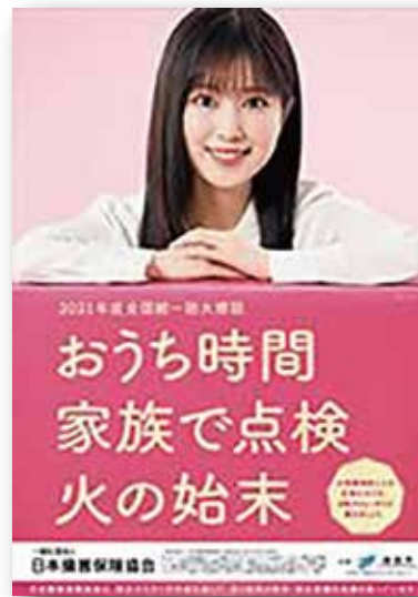
令和3年度 全国統一防火標語