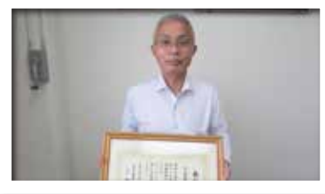
日ノ丸自動車株式会社 米子支店 様