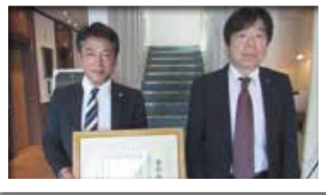
株式会社ホテル ハーベストイン米子 様