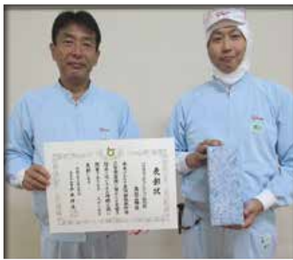
【危険物優良事業所表彰】 グリコマニュファクチャリング ジャパン株式会社鳥取工場 様